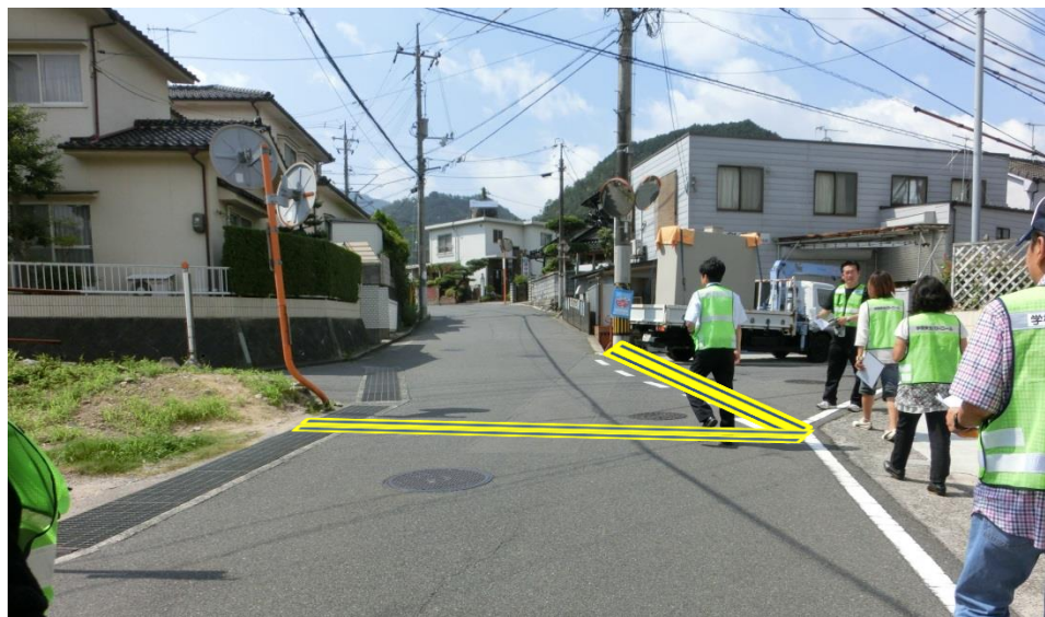
学校から桐原方向視点

点線のラインを昨年度引いて頂いたが、十分な注意喚起がされているようにみえない事から児童の安全な登下校を支えるための追加措置として横断歩道を要望。